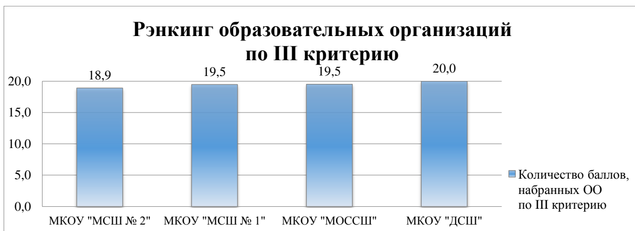
Диаграмма 3. Рэнкинг образовательных организаций по критерию «Доброжелательность, вежливость, компетентность работников»

Рэнкинг образовательных организаций по критерию «Доброжелательность, вежливость, компетентность работников» представлен на Диаграмме 3.