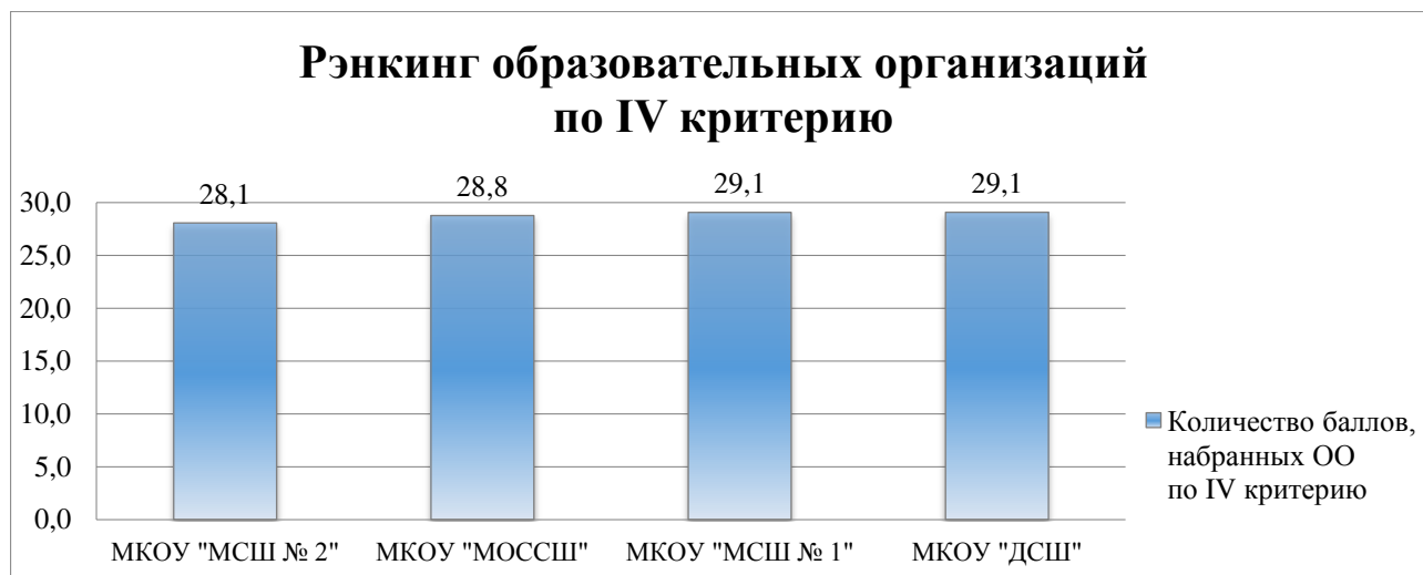
Диаграмма 4. Рэнкинг образовательных организаций по критерию «Удовлетворенность качеством образовательной деятельности организации»

Рэнкинг образовательных организаций по критерию «Удовлетворенность качеством образовательной деятельности организации» представлен на Диаграмме 4.