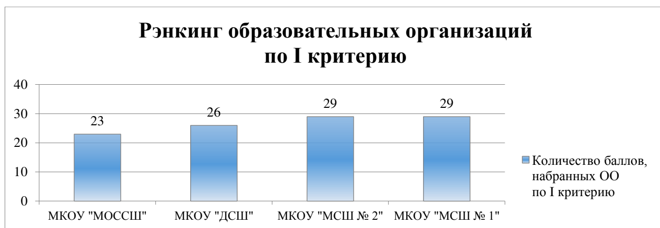
Диаграмма 1. Рэнкинг образовательных организаций по критерию «Открытость и доступность информации об образовательной организации»

Критерий оценки качества деятельности образовательной организации, касающийся комфортности условий осуществления образовательной деятельности, рассматривался на основе показателей, характеризующих материально-техническое и информационное обеспечение; условия для охраны, укрепления здоровья и организации питания; условия для индивидуальной работы с обучающимися, развития их творческих способностей и интересов; наличие дополнительных образовательных программ; возможности оказания психолого-педагогической помощи обучающимся; условия организации обучения обучающихся с ограниченными возможностями.